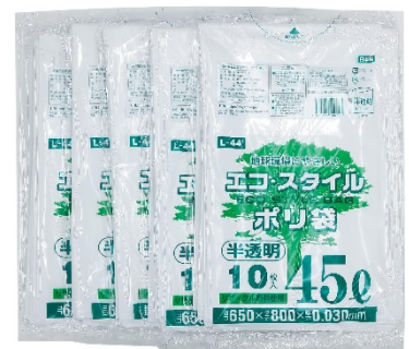
(写真例)半透明のゴミ袋